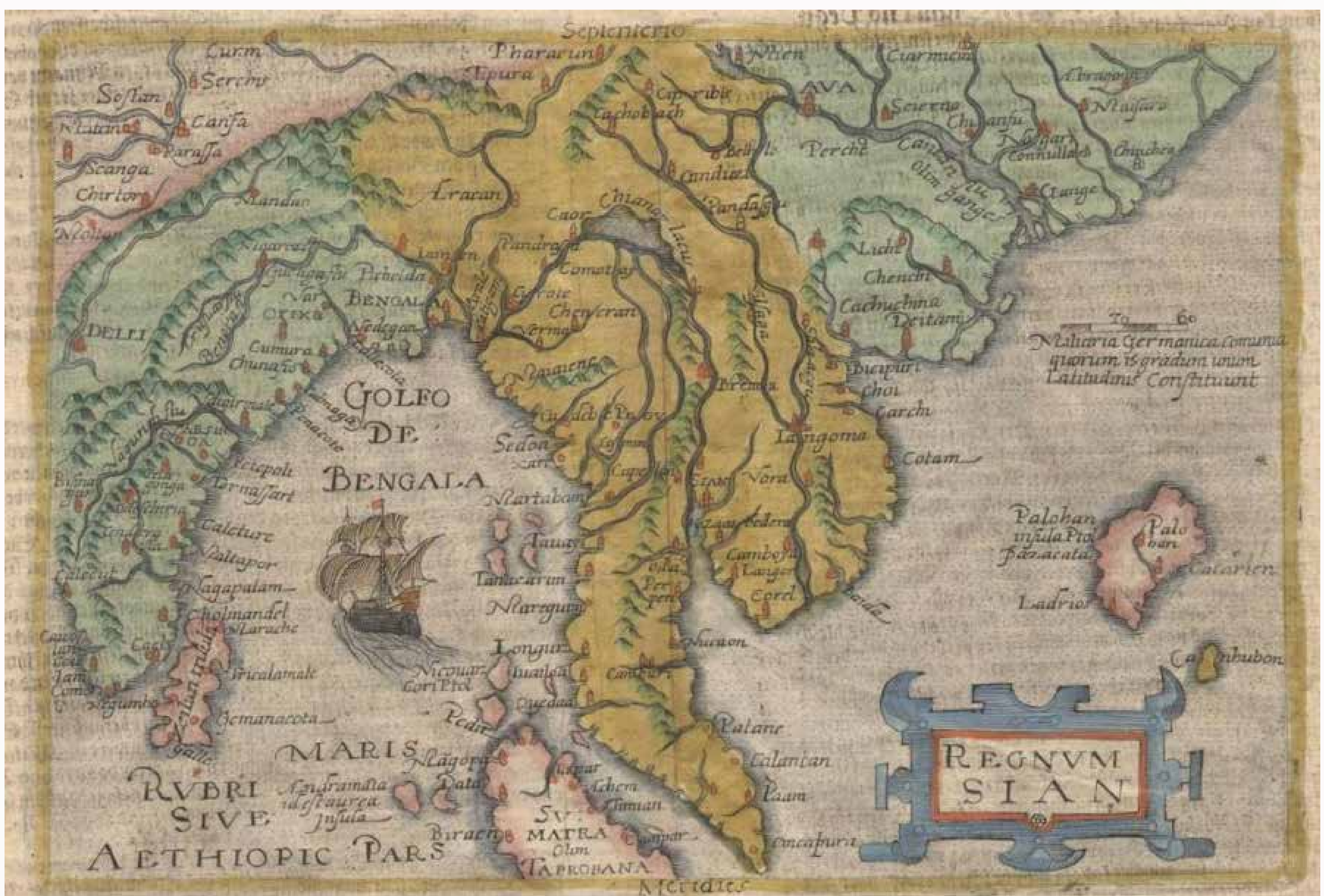
ภาพแผนที่ Regnum Sian หรือ อาณาจักรสยาม หมายเหตุ: จาก ศิลปวัฒนธรรม, โดย รัชชชัย ตั้งศิริวานิช, 2563.