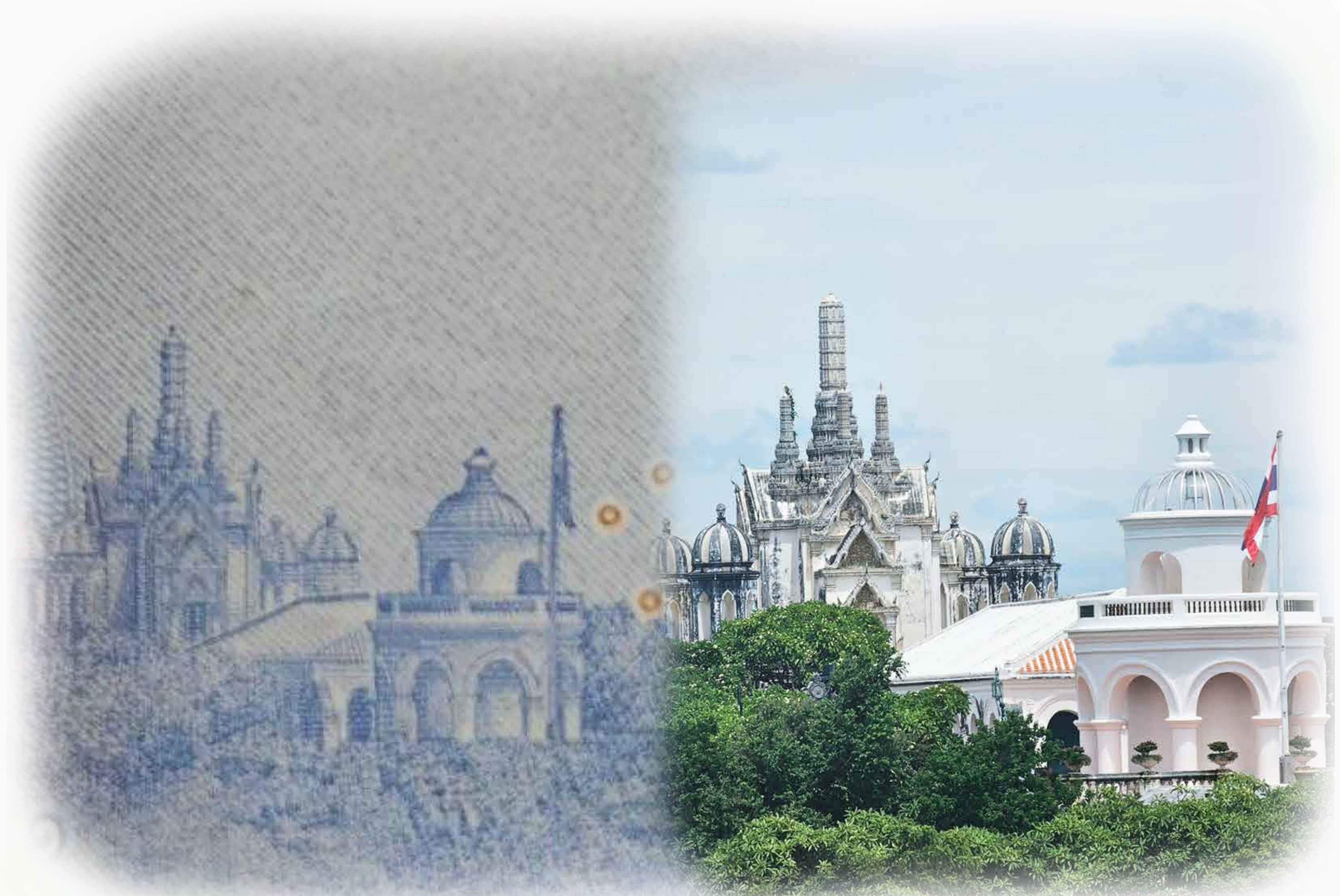
ภาพเวทียงบนธนบัตร ความอัจฉริยะของกษัตริย์ที่ซ่อนในภาพ