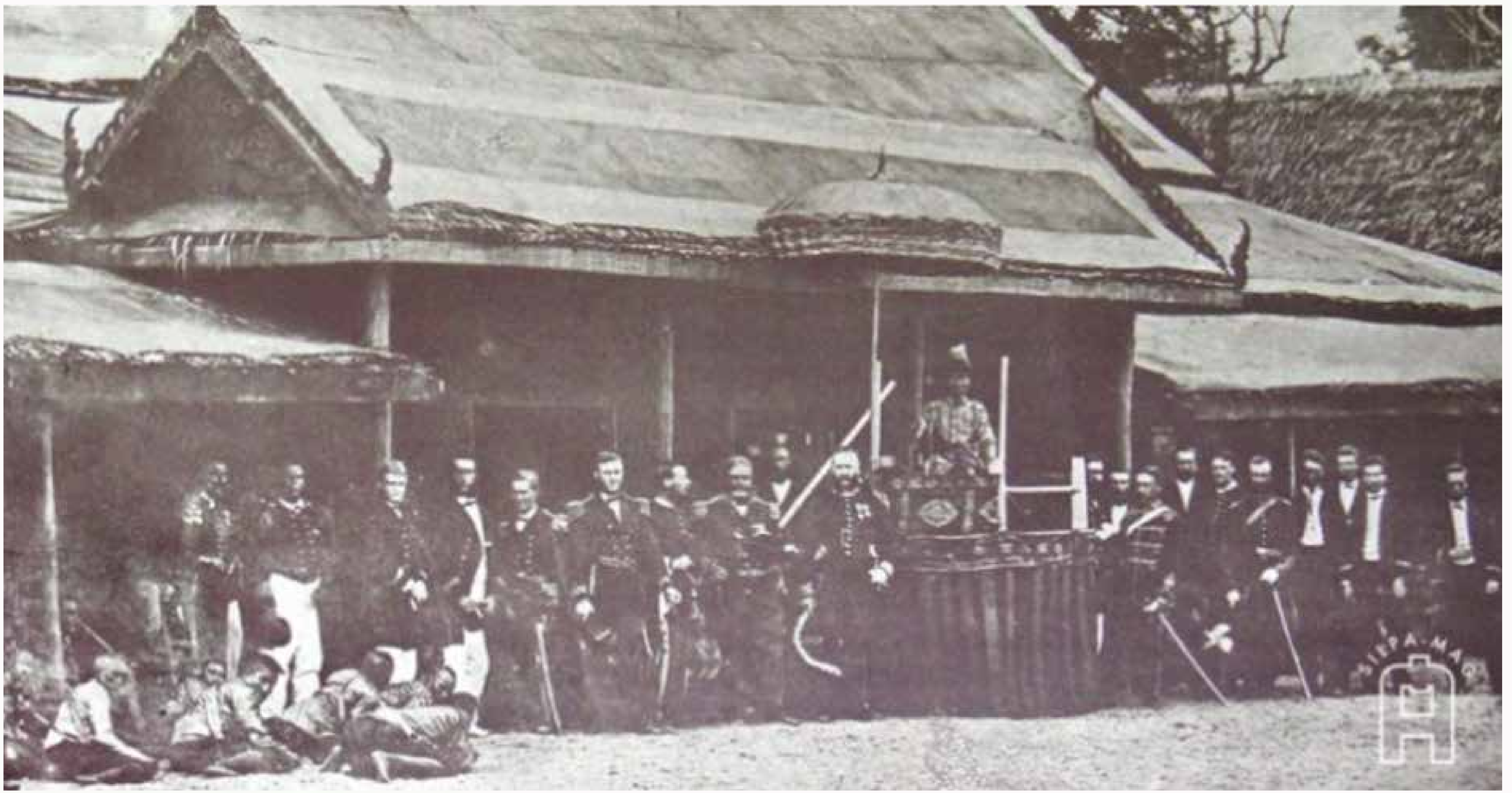
ภาพพระบาทสมเด็จพระจอมเกล้าเจ้าอยู่หัว ประทับ ณ เกยหน้าพลับพลา ที่ประทับ โปรดให้ฉายพระรูปกับคณะแขกเมือง ณ ค่ายหลวงบ้านหว่ากอ หมายเหตุ: จาก ศิลปวัฒนธรรม, โดย ปราบินทร์ เครือทอง, 2568.