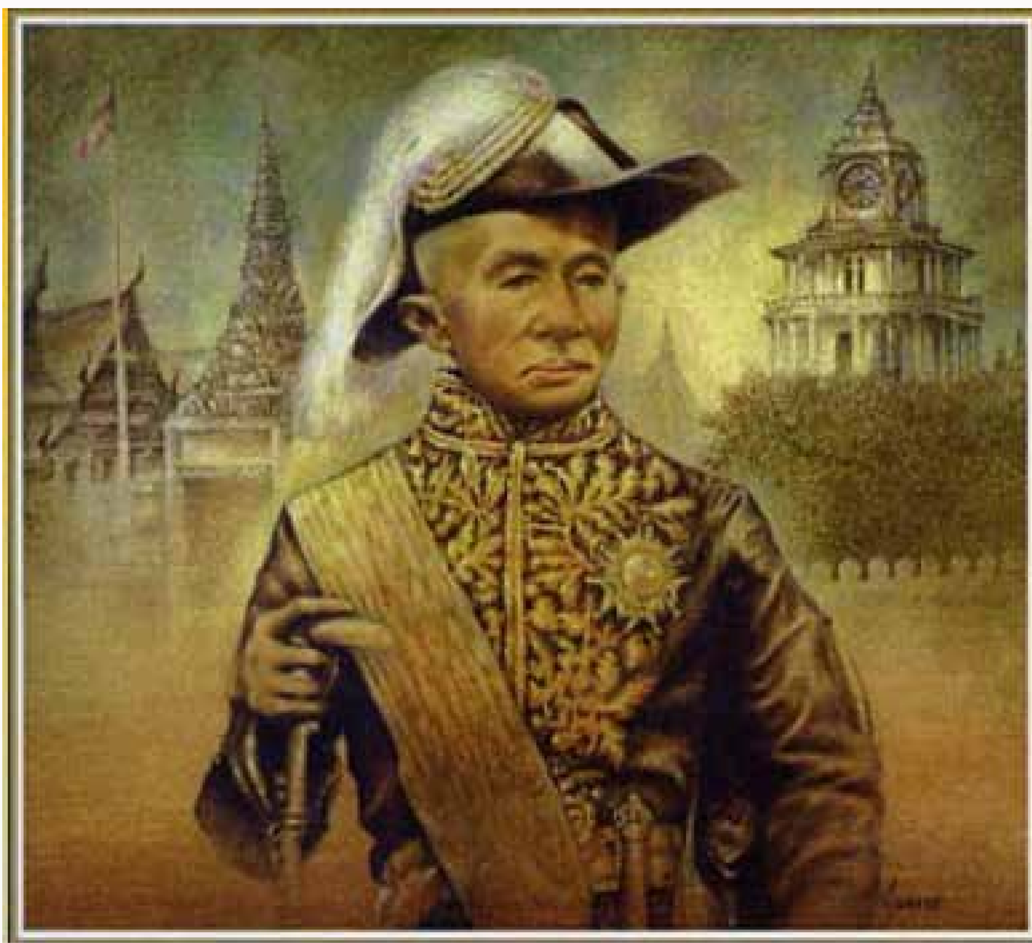
Picture of King Rama IV, and in the background the Royal Clock Tower at the Royal Palace in Bangkok