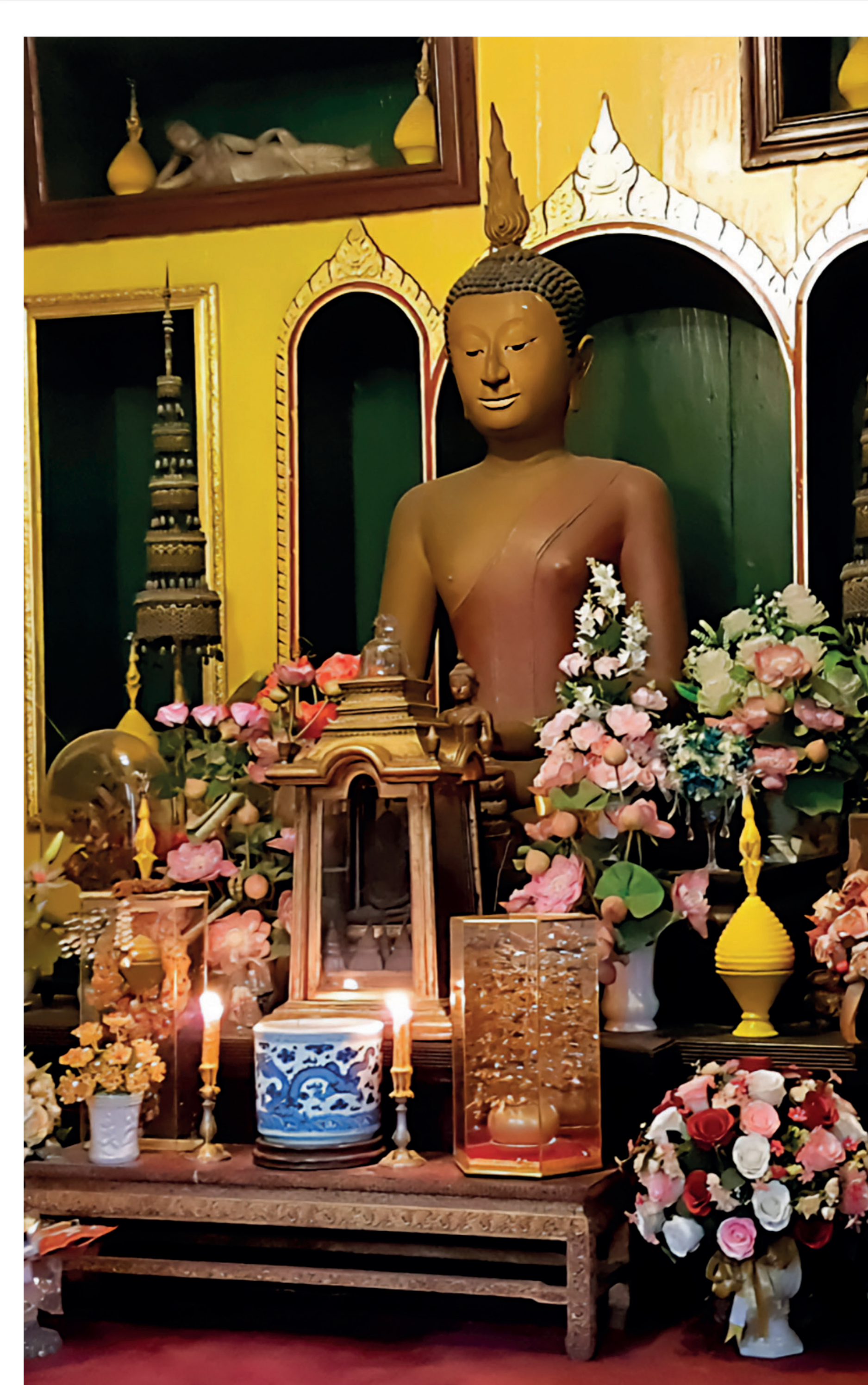
พระพุทธรปรีตร หอศาสตราคม ในพระบรมมหาราชวัง

...ท่านจึงร่วมกับสมเด็จพระยาปวเรศวริยาลงกรณ์ แล้วแต่งเป็นคัมภีร์ ชื่อว่า “คัมภีร์สุคตวิทิตวิธาน” โดยเทียบสเกลกับเซนติเมตรและนิ้วของตะวันตกทั้งยังโปรดให้พระภิกษุลังกา วัดขนาดพระกันตธาตุ (พืน) ของพระพุทธรเจ้ามาคิดคำนวณเทียบบัญญัติไตรยางค์เป็นขนาดสเกลของพระพุทธรเจ้าที่เรียกว่า “คืบพระสุคต” เมื่อได้ขนาดที่กำหนดแล้วจึงโปรดให้ใช้หวายสานขึ้นเป็นพระพุทธรูปประดิษฐานไว้ที่หอศาสตราคม หน้าพระที่นั่งอมรินทรวินิจฉัยในพระบรมมหาราชวัง พระราชทานนามว่า “พระพุทธรปรีตร” ด้วยเหตุนี้ พระพุทธรูปที่รัชกาลที่ 4 ทรงสร้างขึ้นสืบมาตลอดรัชกาลล้วนมีขนาดใกล้เคียงมนุษย์ปกติกันทั้งสิ้น อาทิ พระประธานในวัดมกุฏกษัตริยาราม พระประธานในพระวิหารหลวงวัดพระปฐมเจดีย์ จังหวัดนครปฐม หรือพระพุทธรูปหน้าพระอุโบสถวัดเสนาสนาราม จังหวัดพระนครศรีอยุธยา เป็นต้น...”