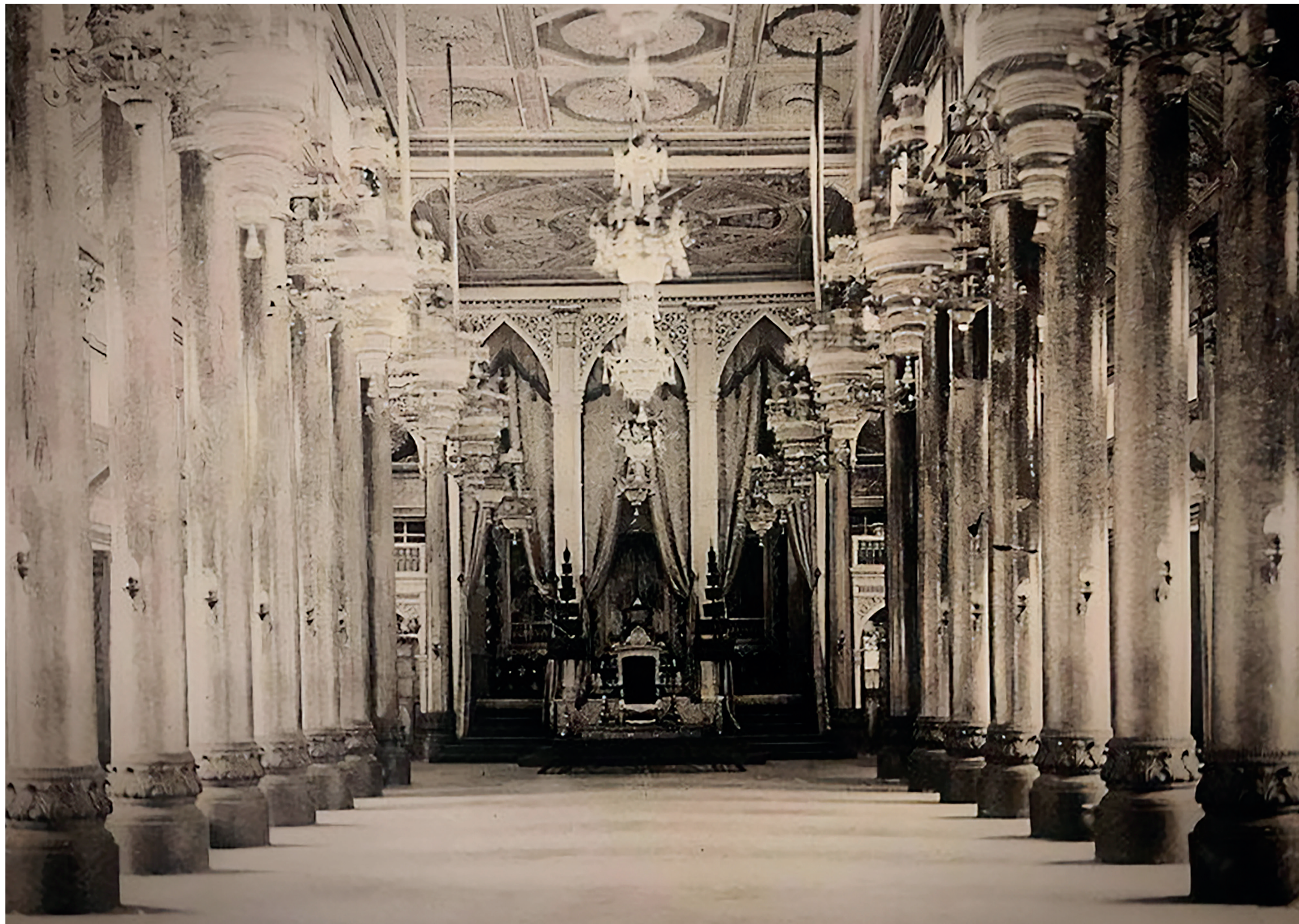
พระที่นั่งอนันตสมาคมเป็นพระโรงเสด็จออกเฝ้าหน้า เดิมเป็นพระราชมณเฑียรหมู่หนึ่งในพระอภิเนาวนิเวศน์

“...หมู่พระอภิเนาวนิเวศน์ สร้างด้วยศิลปะแบบนีโอคลาสสิก นับเป็นครั้งแรกที่ปรากฏศิลปะตะวันตกในสมัยรัตนโกสินทร์ รวมถึงพระตำหนักที่พระนครคีรี เพื่อแสดงออกถึงความมีอารยะในทางศิลปกรรม และใช้ในการต้อนรับพระราชอาคันตุกะและทูตานุทูต ดังเช่นเมื่อทำสนธิสัญญากับเซอร์จอห์นเบาว์ริง...”