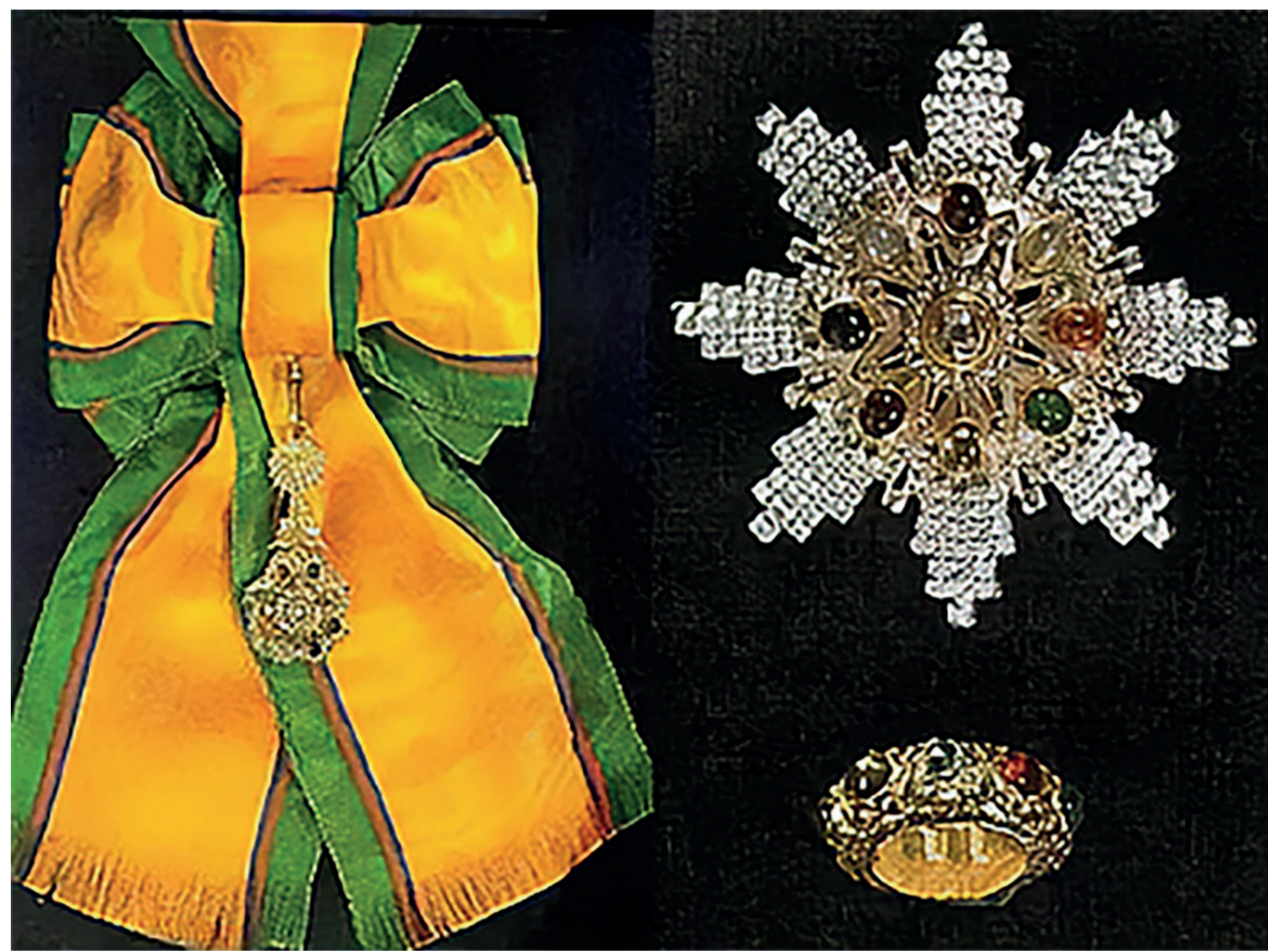
เครื่องราชอิสริยาภรณ์อันเป็น โบราณมงคลนพรัตนราชวรารณ์