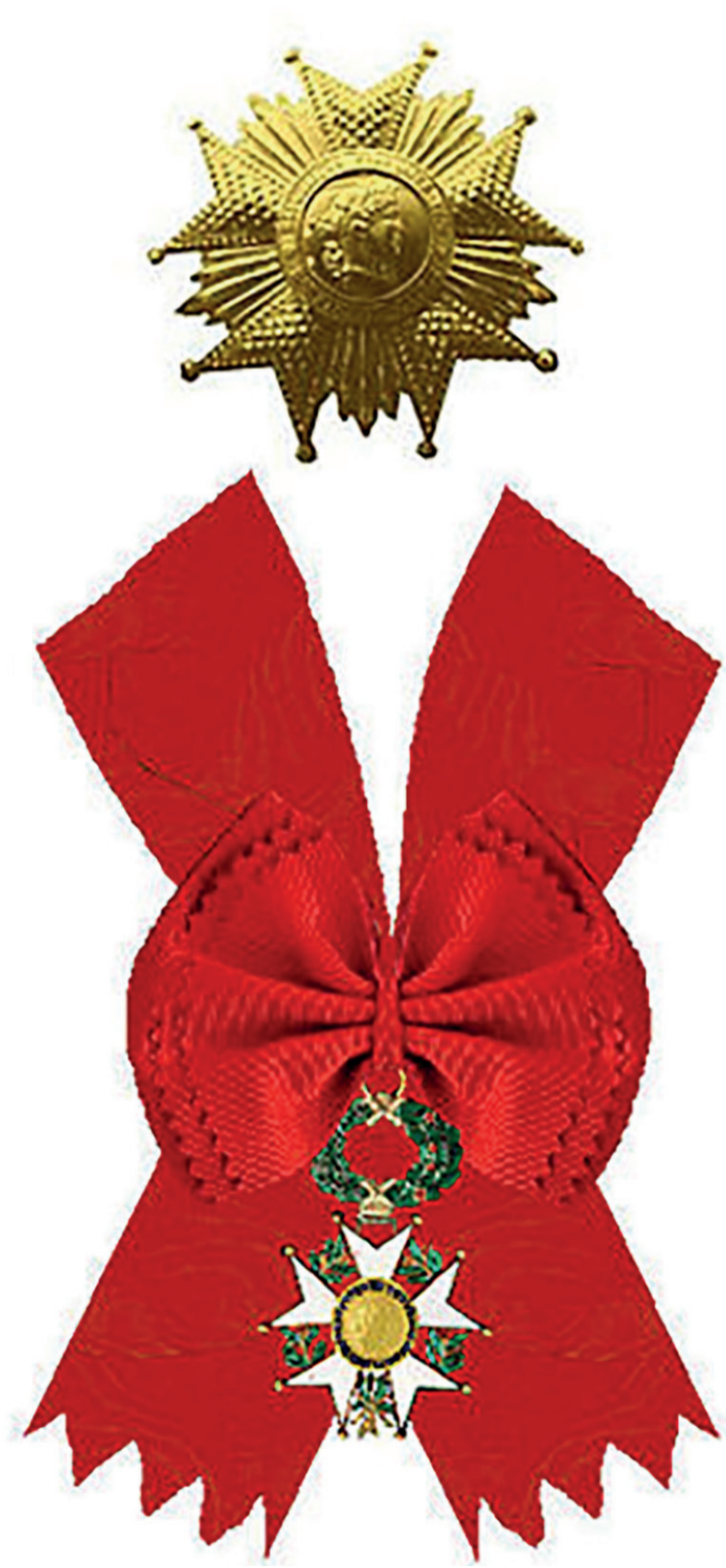
เครื่องอิสริยาภรณ์เลฌียง ดอนเนอร์ ชั้น กร็อง-คร็ว

* (เสนา่ อ่านว่า สะ-หน้า หรือ เส-นำ คือ พระแสงมิดสัน)