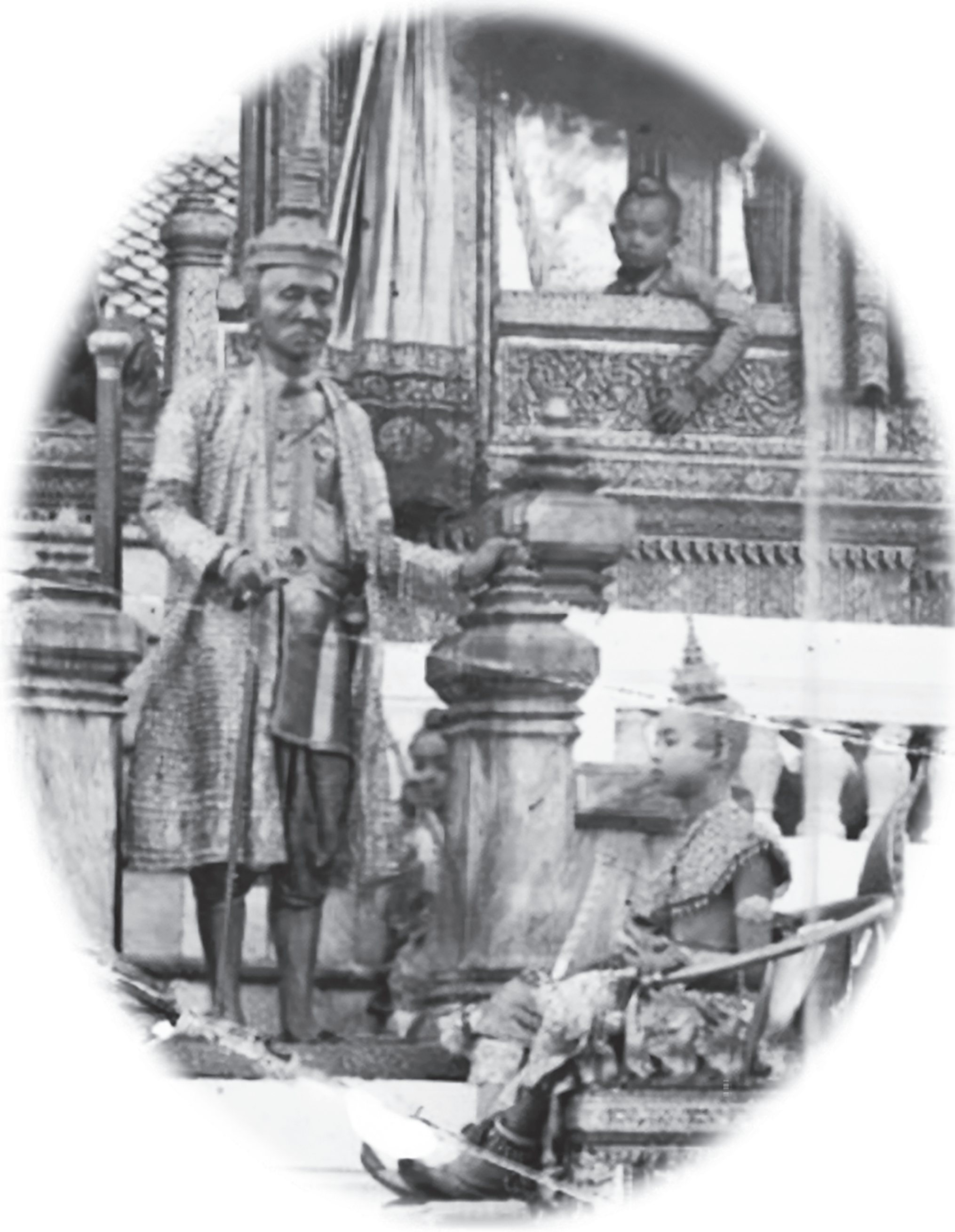
พระที่นั่งอาภรณ์พิโมกษ์ปราสาท ขณะพระราชพิธีโสกันต์ เจ้าฟ้าจุฬาลงกรณ์ (รัชกาลที่ 5) พ.ศ. 2408

อาจารย์ประจำสาขาวิชาโรงเรียนการท่องเที่ยวและการบริการ มหาวิทยาลัยสวนดุสิต