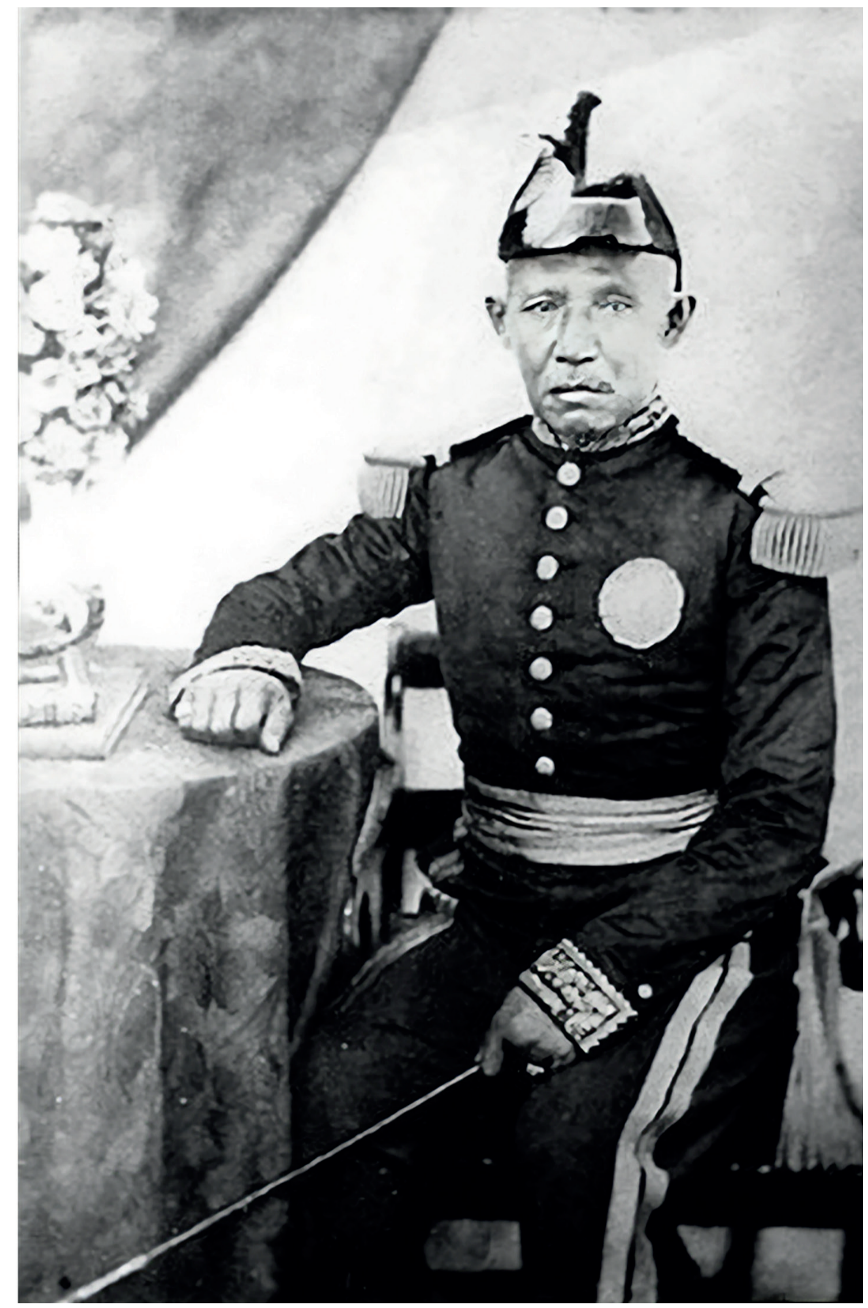
พระบรมฉายาลักษณ์พระบาทสมเด็จพระปวงเรนทราเมศวร พระปิ่นเกล้าเจ้าอยู่หัว

“...รัชกาลที่ 4 ทรงมีเพื่อนคู่คิด คือ พระบาทสมเด็จพระปิ่นเกล้าเจ้าอยู่หัว ทั้งสองท่านถือเป็นบุคคลสองคนแรก ๆ ของประเทศสยามและในเอเชียตะวันออกเฉียงใต้ที่สามารถพูดภาษาอังกฤษได้ มีความเข้าใจลึกซึ้งในชาติมหาอำนาจ