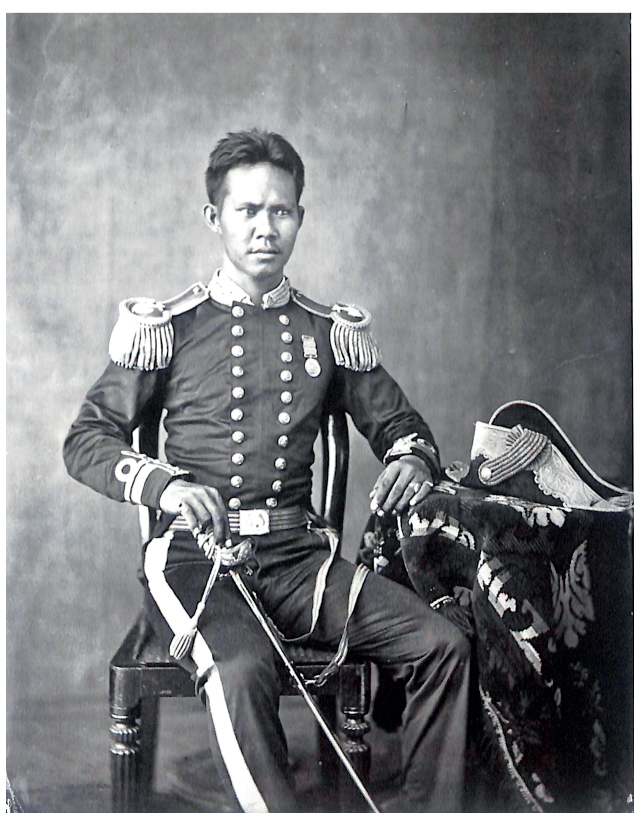
กรมพระราชวังบวรวิไชยชาญ (พระองค์เจ้ายอด้วยังยศ) พระราชโอรสองค์ที่ 3 ในพระบาทสมเด็จพระปิ่นเกล้าเจ้าอยู่หัว

“...รัชกาลที่ 4 ทรงมีเพื่อนคู่คิด คือ พระบาทสมเด็จพระปิ่นเกล้าเจ้าอยู่หัว ทั้งสองท่านถือเป็นบุคคลสองคนแรก ๆ ของประเทศสยามและในเอเชียตะวันออกเฉียงใต้ที่สามารถพูดภาษาอังกฤษได้ มีความเข้าใจลึกซึ้งในชาติมหาอำนาจ