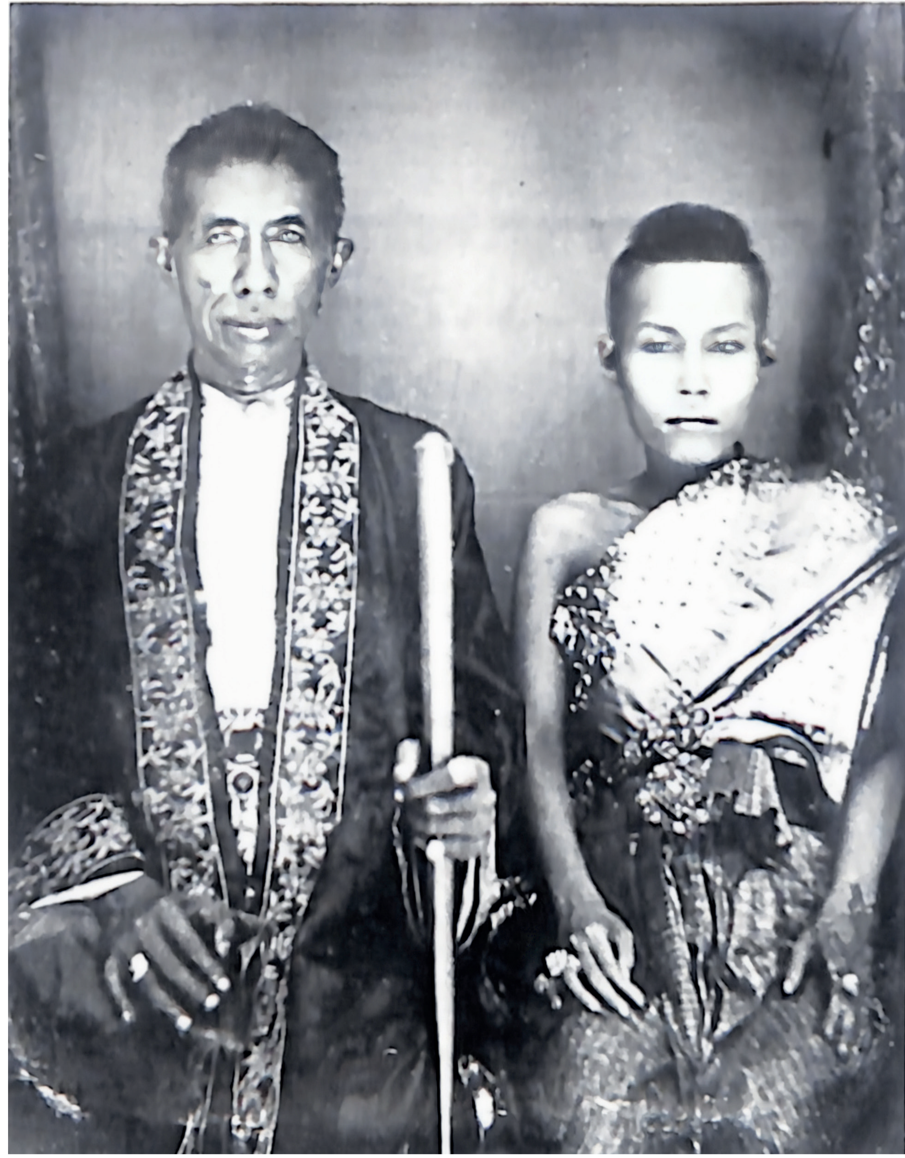
พระบาทสมเด็จพระจอมเกล้าเจ้าอยู่หัว และ สมเด็จพระเทพศิรินทราบรมราชินี ฉายเมื่อ พ.ศ. 2399

“...ในสมัยรัชกาลที่ 4 นับเป็นยุคแรกที่ทรงมีการให้เกียรติผู้หญิงให้มีสถานภาพเท่าเทียมกับตนเอง และมีรูปกษัตริย์ประทับร่วมกับพระราชินีเริ่มขึ้นเป็นครั้งแรก เดิมในธรรมเนียมโบราณการออกแบบพระที่นั่ง พระโอรนบัลลังก์ของประเทศในเอเชียจะออกแบบเพียงที่นั่งเดียวคือผู้ชายเป็นฝ่ายนั่ง รัชกาลที่ 4 ทรงเห็นว่าประเทศตะวันตกมีที่นั่งสองเก้าอี้จึงทรงนำมาปรับใช้กับไทย...”